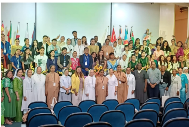
Figura 2. Participantes do IV Encontro Mundial das Instituições Salesianas de Ensino Superior realizado em Laguna, Filipinas.

O encontro foi realizado em Laguna, nas Filipinas, reunindo representantes da América Latina, Europa, Ásia e África em torno do tema "Empowerment of Young People to be Protagonists of Social Transformation" (Empoderamento dos Jovens como Protagonistas da Transformação Social).