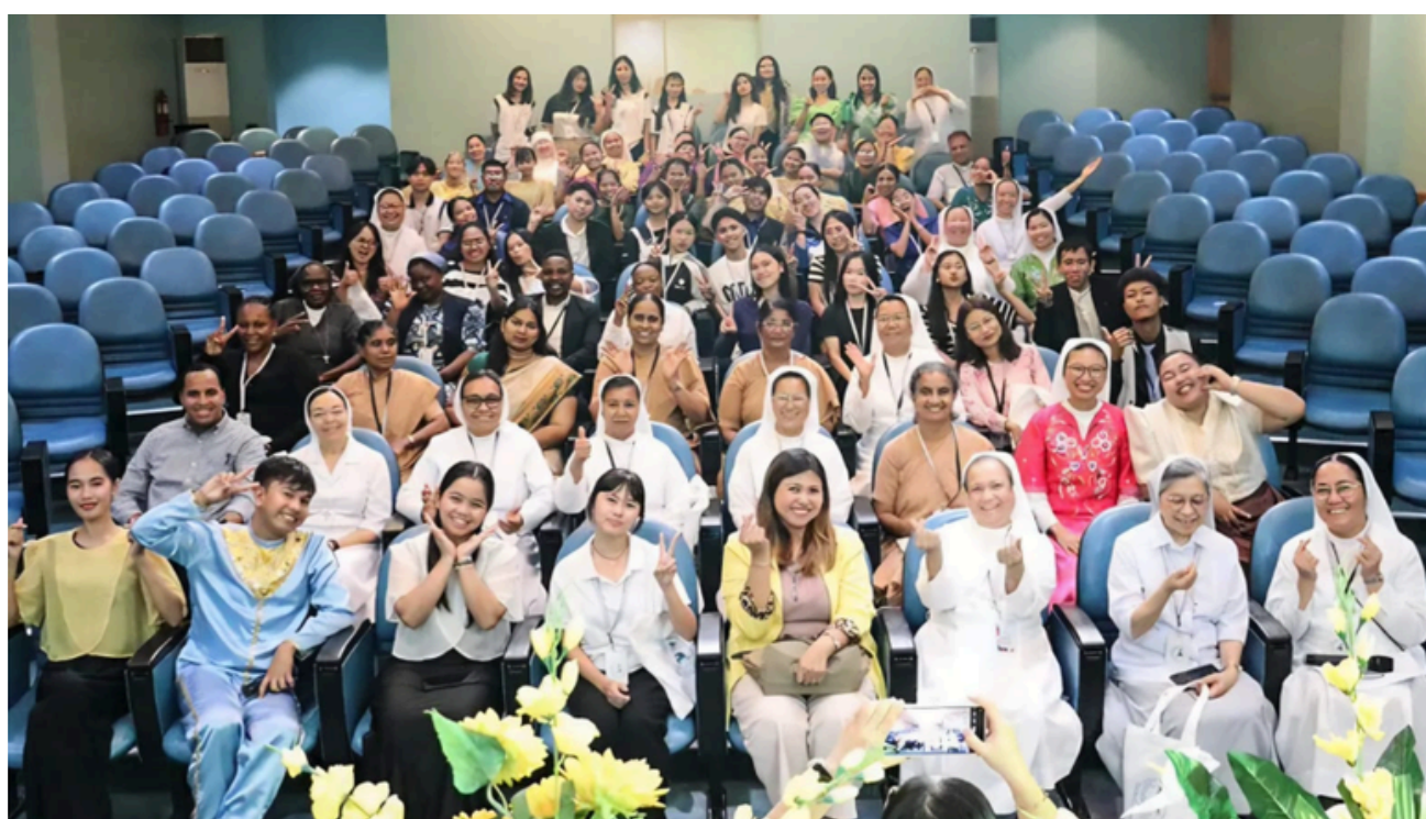
Figura 5. Representantes das instituições participantes do encontro internacional.

Para o ISECENSA, a participação representou uma valiosa oportunidade de troca de experiências e de aproximação com iniciativas internacionais voltadas ao protagonismo juvenil. A vivência reforçou que os jovens não são apenas beneficiários das transformações sociais, mas protagonistas capazes de liderar mudanças positivas em suas comunidades e contribuir para a construção do futuro.