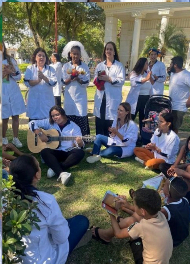
Figura 4: Atividade desenvolvida no Jardim São Benedito em comemoração ao Dia Nacional do Livro Infantil.

A atividade marcou oficialmente o lançamento do projeto de extensão do curso, cuja proposta central é ampliar o acesso à Literatura e estimular práticas leitoras em diferentes espaços sociais e educativos. Além das ações em praças públicas, o projeto prevê atividades em pediatrias hospitalares, casas de acolhimento e instituições parceiras, fortalecendo a literatura como instrumento de formação humana, inclusão e transformação social.