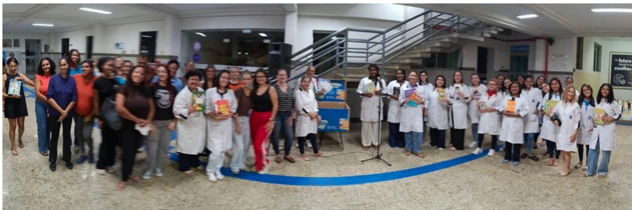
Figura 1: Lançamento do projeto de extensão “Adote um Leitor” com participação de estudantes, docentes e equipe gestora do ISECENSA.

A leitura ocupa papel central na formação educacional, cultural e social dos indivíduos, especialmente na infância. Mais do que um instrumento pedagógico, a Literatura possibilita desenvolvimento da imaginação, ampliação do repertório cultural, fortalecimento da linguagem e construção de vínculos afetivos e sociais. Neste contexto, iniciativas voltadas à formação de leitores tornam-se cada vez mais relevantes diante dos desafios contemporâneos relacionados ao acesso à leitura e ao incentivo às práticas literárias.