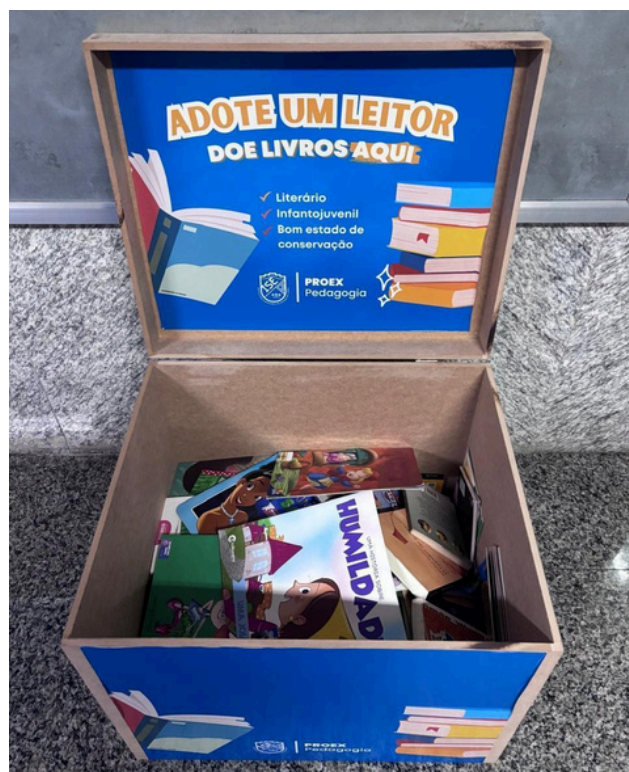
Figura 2: Ponto permanente de arrecadação de livros infantis na área externa do ISECENSA.

de direção Beatriz Mateus e da coordenadora do curso de Pedagogia, Ana Raquel de S. Pourbaix (Fig. 1). Como parte da mobilização inicial, foi instalado na área externa do ISECENSA um ponto permanente de arrecadação de livros literários infantis em bom estado de conservação, aberto à participação de toda a comunidade acadêmica e externa (Fig. 2).