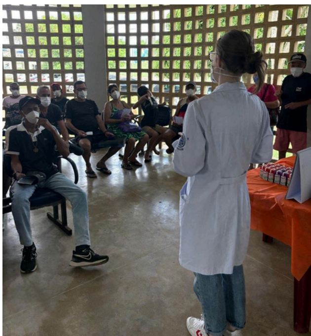
Figura 1: Estudantes do curso de Enfermagem do ISECENSA durante ação educativa em sala de espera no Centro de Referência Augusto Guimarães em Campos dos Goytacazes/RJ.