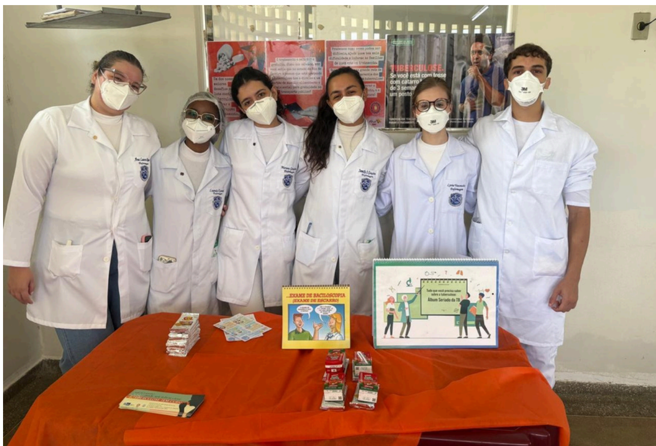
Figura 4: Ação extensionista desenvolvida pelos alunos do 7º período em parceria com a Secretaria Municipal de Saúde.

Mais do que uma atividade extensionista, a iniciativa evidencia o compromisso do ISECENSA com uma formação conectada às demandas reais da sociedade e alinhada aos princípios do Sistema Único de Saúde.