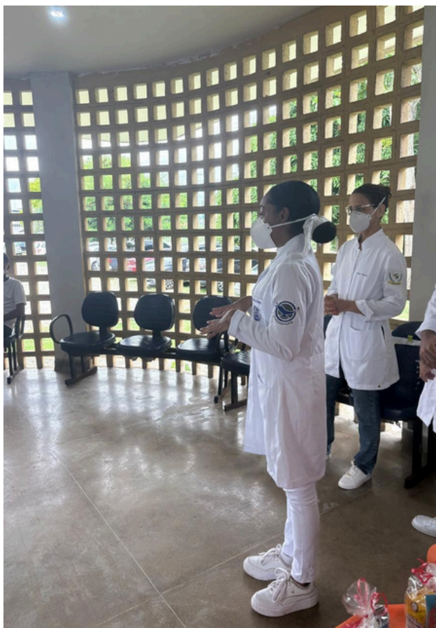
Figura 3: Momentos de diálogo e conscientização sobre prevenção, tratamento e cura da tuberculose.